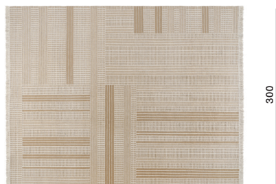
400 428 con frange