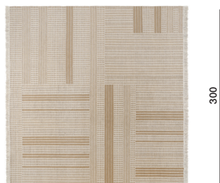
300 328 con frange