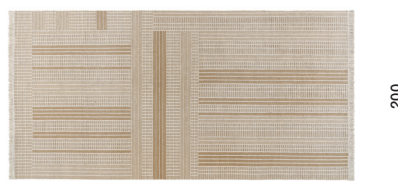
400 428 con frange